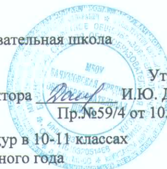
График проведения оценочных процедур в 10-11 классах на 2 четверть 2023-2024 учебного года