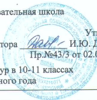
График проведения оценочных процедур в 10-11 классах на 1 четверть 2023-2024 учебного года